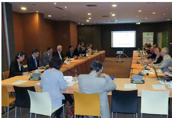
Kulatý stůl pořádaný s nadací Heinrich-Böll-Stiftung Praha k problematice jaderné energetiky