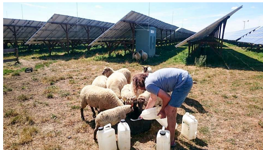
Fotky z natáčení pořadu „Nedej se“ o AliES a solární energetice